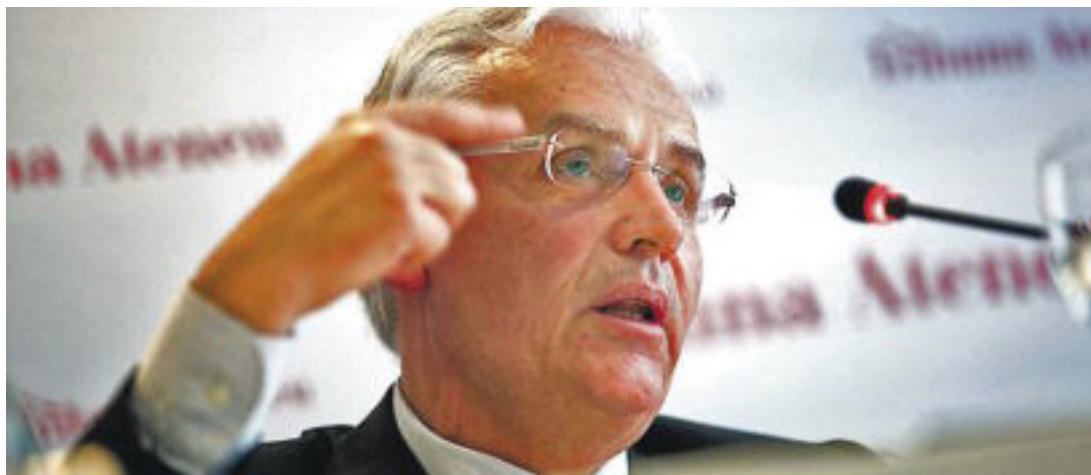
Ferran Mascarell, conseller de Cultura de Catalunya.

Tot aquest enrenou exemplifica bé aspectes espinosos del món en què vivim. Veiem, per exemple, com les lleis d'un govern no signifiquen res davant dels interessos de les grans empreses. Mana qui pot i no qui