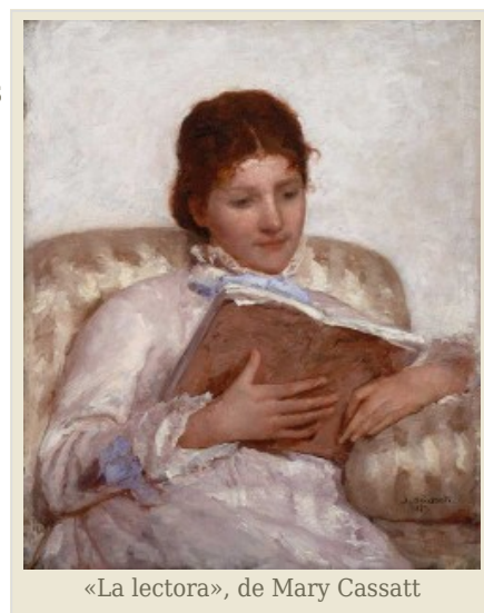
«La lectora», de Mary Cassatt

Jo estic per potenciar la lectura en temps de crisi, amic lector. Amic professor. No perquè siga escriptor i parle egoïstament. Sinó perquè, sense deixar d'haver sigut mai lector, ha estat la lectura la que m'ho ha donat tot..., fins i tot la voluntat de ser escriptor..., i de ser millor persona.