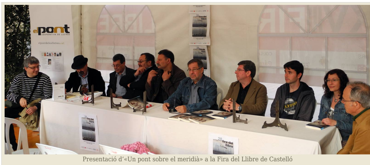
Presentació d'«Un pont sobre el meridià» a la Fira del Llibre de Castelló

Vinaròs i Móra d'Ebre. Ara és el moment d'ampliar aquesta projecció a altres àmbits, com puga ser la Setmana del Llibre en Català, de Barcelona. D'altra banda, la pàgina que el llibre té a Facebook és un bon catalitzador per copsar que té un públic que va creixent des del moment que va posar-se en funcionament.